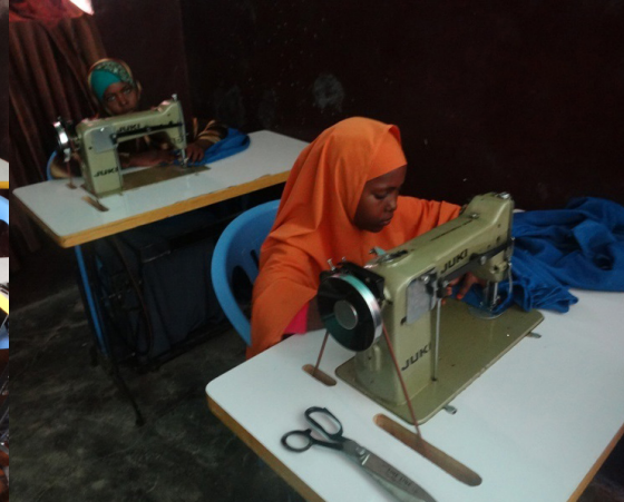
LES PREMIÈRES ATTESTATIONS SONT REMISES DANS UNE AMBIANCE FESTIVE.